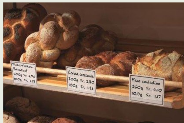
Indicazione dei prezzi in una panetteria

E la SECO cosa fa? La SECO consiglia i Cantoni e funge da interlocutore per le organizzazioni e i settori interessati. Pubblica inoltre opuscoli che illustrano l'applicazione concreta dell'obbligo di indicare i prezzi. Una panoramica delle norme generali è fornita dall'opuscolo «OIP – Guida pratica». Esistono però anche opuscoli specifici per i diversi settori. Il titolare di un negozio online può trovare le necessarie informazioni corredate di esempi nell'opuscolo «Commercio online di merci», un venditore di generi alimentari può consultare l'opuscolo «Corretta indicazione di prezzi e quantità» e un concessionario di auto l'opuscolo «Veicoli a motore».