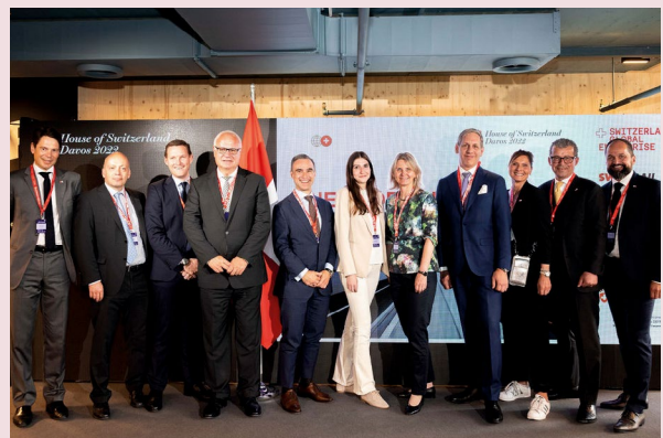
Rappresentanti di associazioni, strumenti di finanziamento e servizi federali alla presentazione congiunta al WEF 2022.

L'approccio del Team Switzerland risulta essere vincente: gli appaltatori generali stranieri mostrano infatti grande interesse a integrare prodotti svizzeri di qualità nelle loro catene di fornitura, tanto che molti di essi hanno aperto una filiale in Svizzera. Dall'inizio del suo mandato, inoltre, la SERV ha potuto assicurare progetti per diverse centinaia di milioni di franchi, ai quali hanno partecipato numerosi esportatori.